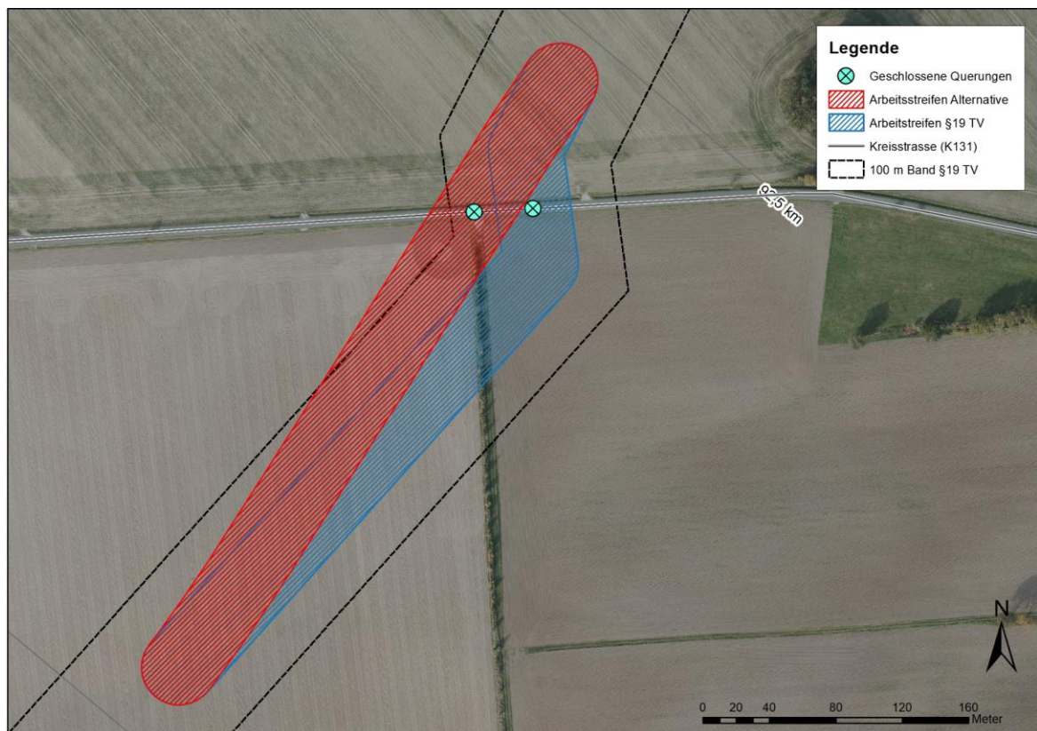
Abbildung 1: Übersicht des Alternativenvergleichs Alternative Galgenberg